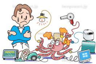
タコ足配線などの改善