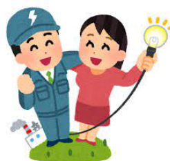
蛍光灯などの電球交換